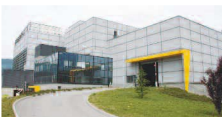
L'usine de valorisation énergétique et de traitement des déchets de Savoie Déchets

Créé le 1 er janvier 2010, le Syndicat Mixte "Savoie Déchets" possède la compétence "traitement des ordures ménagères". 14 collectivités adhèrent à ce syndicat, soit plus des 2/3 du département de la Savoie. Sa vocation? Mutualiser les filières de traitement en regroupant les besoins de ses adhérents et optimiser les coûts. La création de Savoie Déchets a permis de capter des tonnages importants d'ordures ménagères, permettant d'atteindre le seuil de bon fonctionnement de l'usine de valorisation énergétique de Chambéry (115 000 tonnes de déchets incinérées par an).