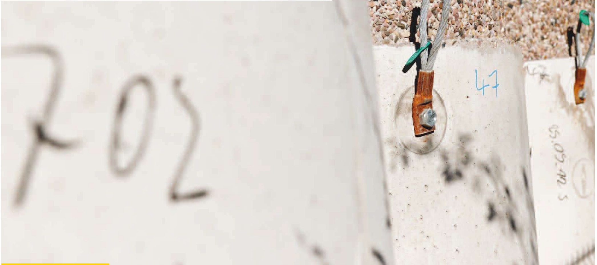
Détail d'un conteneur semi-enterré avant installation