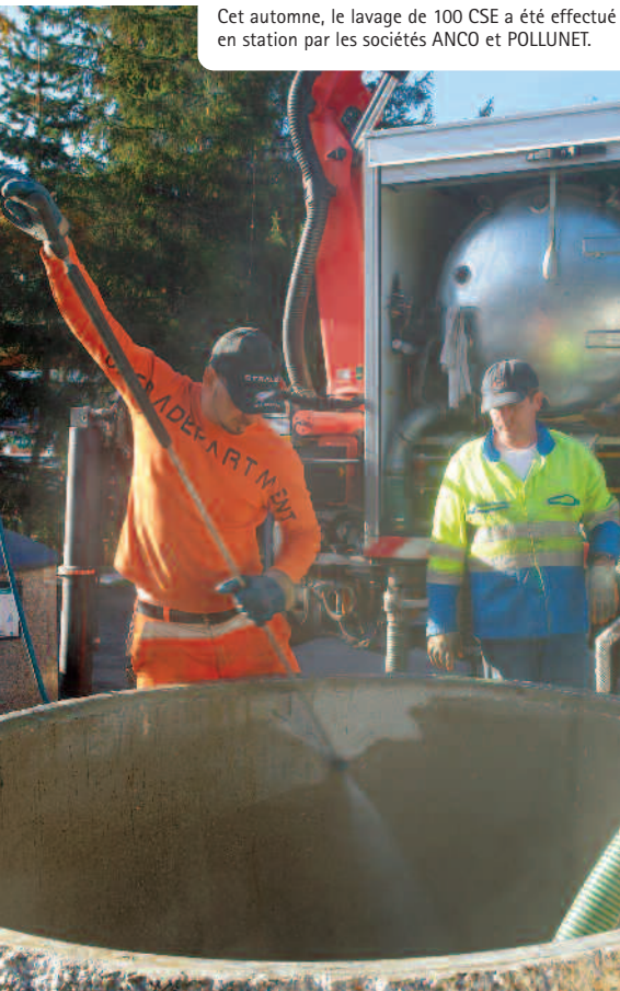
Cet automne, le lavage de 100 CSE a été effectué en station par les sociétés ANCO et POLLUNET.

En effet, il lui faudra faire quelques dizaines de mètres supplémentaires pour aller déposer sa poubelle au CSE le plus proche... Cela change de la collecte en bacs roulants, mais les personnes déjà habituées à trier leurs déchets et à les déposer en point d'apport volontaire n'auront pas trop de mal à s'adapter à ces changements. Dans tous les cas, les usagers recevront la visite de nos ambassadrices de tri, afin d'être informés des lieux d'implantation de CSE sur leur commune et des consignes de tri. Gageons que la solidarité des Mauriennais fera le reste ! Rien ne vous empêche en effet de prendre avec vous le petit sac poubelle de votre voisine âgée pour le déposer avec le vôtre !