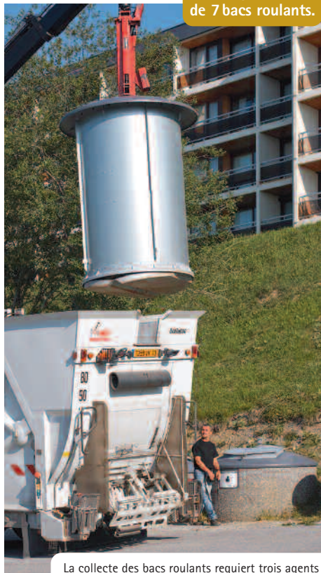
La collecte des bacs roulants requiert trois agents : un chauffeur et deux rippeurs. Celle des CSE ne nécessite plus qu'un seul agent : un chauffeur spécialisé dans la collecte en évolupac...

5 m 3 : c'est le volume d'un CSE, soit l'équivalent de 7 bacs roulants.